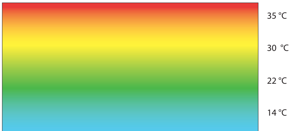
SENZA L'USO DEI DESTRATIFICATORI

far funzionare gli apparecchi riscaldanti fino a creare sotto il soffitto uno strato di aria calda di circa 31°C. Per raggiungere questo risultato occorre riscaldare l'intero volume del locale con una temperatura media di 25°C. Nei casi di coibentazione carente della copertura, il fenomeno della stratificazione sembra meno evidente perchè il calore si disperde all'esterno, con sprechi ancora più evidenti di energia termica, e costi superiori alle effettive necessità. Occorre quindi impedire l'accumulo di calore e la sua dispersione nella zona alta dello stabile, con un ricircolo costante dell'aria nell'ambiente.